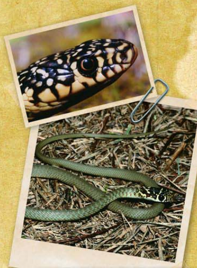
Couleuvre verte et jaune