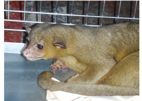
Kinkajou (potos flavus) Carnivore exotique d'Amérique du Sud capturé par les sapeurs-pompiers animaliers du GSA.